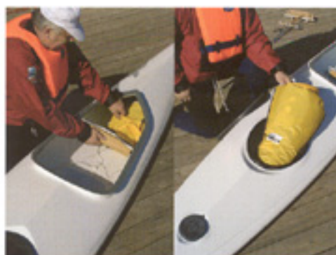
Masser af stuevarer til langturen både foran og bagved cockpit.

Det indstillelige fodspark er af typen hammelstyr, der fylder minimalt på tværs i kajakken og giver plads til en stor pakpose. Foran sidder en opdriftsklod på højkant, som let kan tages ud når der er behov for bagage foran.